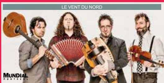
LE VENT DU NORD