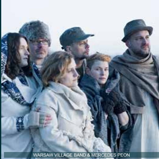
WARSAW VILLAGE BAND & MERCEDES PEON