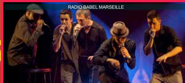
RADIO BABEL MARSEILLE