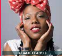
LA DAME BLANCHE