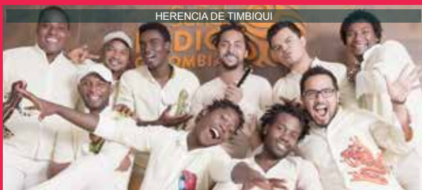
HERENCIA DE TIMBIQUI