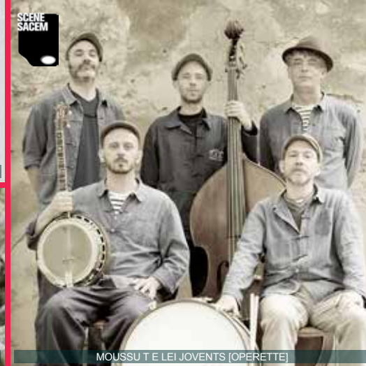
MOUSSU T E LEI JOVENTS (OPERETTE)